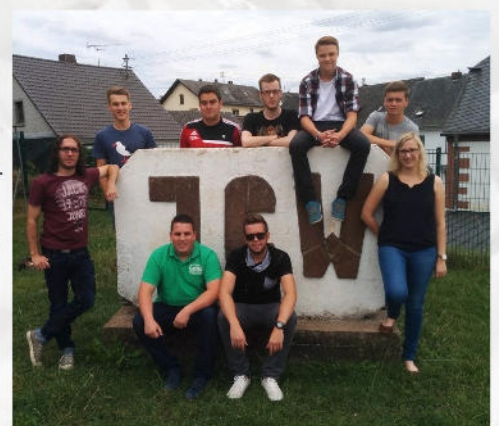
Der aktuelle Vorstand vor dem JCW-Fels

Als Jugendclub eine Kinderbetreuung anzubieten ist dabei natürlich kein Muss. Das Beispiel zeigt aber, dass man nicht nur die eigentliche Zielgruppe im Auge haben sollte. In Wadrill sind sie sich sicher: Junge Leute früh in die Orga einzubinden und die eigenen Nachfolger*Innen im JUZ auch noch zu unterstützen, wenn man selbst nicht mehr so oft vor Ort ist, bzw. auch ruhig einmal bei Ehemaligen um Rat zu fragen, sind wichtige Punkte, wenn es darum geht einen selbstverwalteten Jugendclub über viele Jahre erfolgreich am Laufen zu halten!