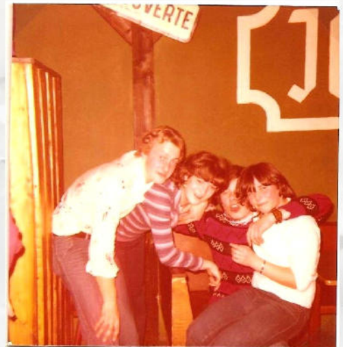
und so sahen junge Menschen aus, als es mit dem Jugendclub losging.

In Wadrill kann man also fast in jedem Alter einen Bezug zum Jugendclub haben. Das Einbinden von jungen Jahren an sorgt für ausreichend Nachwuchs und die verlässliche Unterstützung durch altgediente Ehemalige garantieren ein hohes Maß an Kontinuität. So können die Aktiven sich voll auf ihre Projekte konzentrieren. Seien es die alljährlichen Veranstaltungen wie Ferienfreizeiten, das beliebte Altbier-Wochenende, oder feste Institutionen wie die jugendclubeigene Tischtennisabteilung.